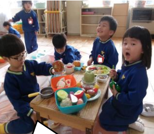
みんな、パーティーするよ〜♪

④ みんなが揃ったら、トイレへ行き、集まって歌を歌ったり、手遊びをしたりします。その後は、日々の計画をもとにいろいろな活動を楽しみます。